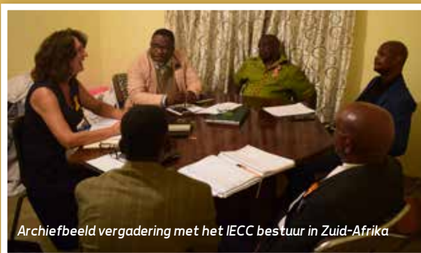
Archiefbeeld vergadering met het IECC bestuur in Zuid-Afrika