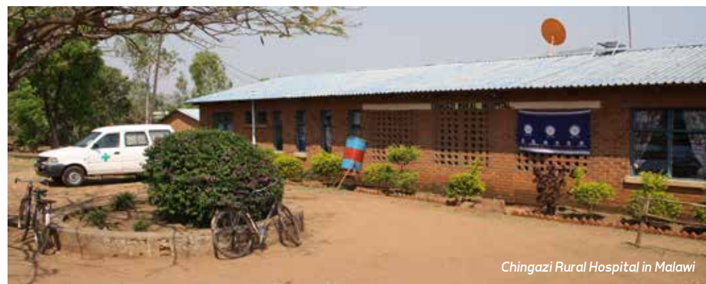
Chingazi Rural Hospital in Malawi