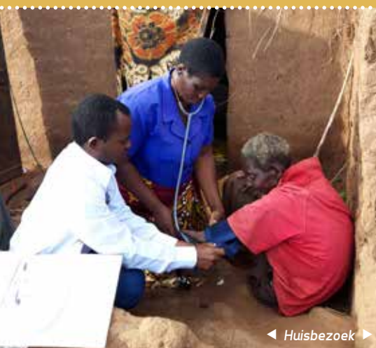
◀ Huisbezoek ▶