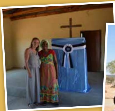
Foto's uit Botswana vanuit een eerder bestuursbezoek