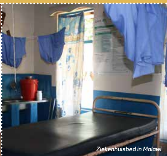
Ziekenhuisbed in Malawi