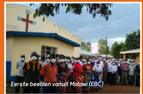
Eerste beelden vanuit Malawi (EBC)

Nederland is opgeschaald naar 2.400 IC-bedden (vóór de coronacrisis ca. 1.200 bedden) op een bevolking van 17 miljoen inwoners.