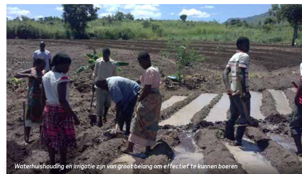
Waterhuishouding en irrigatie zijn van groot belang om effectief te kunnen boeren

We willen op den duur arme gezinnen een koe kunnen schenken onder voorwaarde dat zij hun melkopbrengst (tegen geringe betaling) delen met andere families.