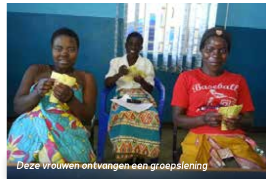
Deze vrouwen ontvangen een groepslening

geld genoeg geld te hebben om een koe te kopen". Flora moedigt ook andere weduwen aan mee te doen met het programma zodat ze ook onafhankelijk worden en op eigen benen kunnen staan.