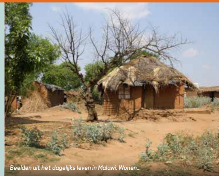
Beelden uit het dagelijks leven in Malawi: Wonen...