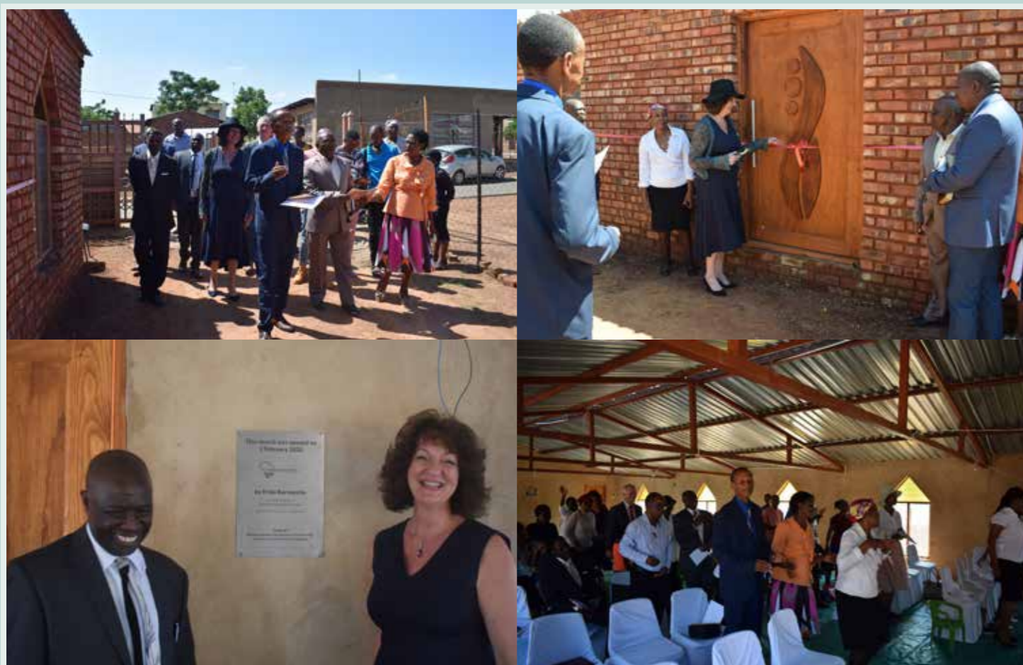
Linksboven: Zingend rondom de kerk | Rechtsboven: Doorknippen van het lint | Linksonder: Plaquette ter herinnering aan de opening | Rechtsonder: In de kerkdienst

NL34 INGB 0003 7233 35 O.V.V. LANDBOUW MALAWI