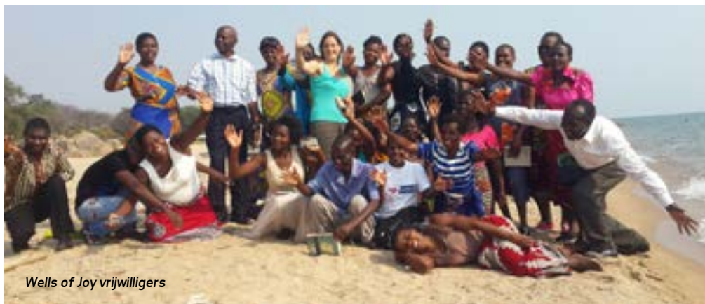
Wells of Joy vrijwilligers

noden als voedsel en medicijnen, maar ook met de sociale en geestelijke behoeftes van mensen. We zijn dit jaar gestart met kleine bijbelstudiegroepjes . Onze vrijwilligers komen samen in de huizen met patiënten en doen Bijbelstudie. Ze maken daarbij gebruik van audiobijbels , omdat de meeste mensen in Malawi niet of moeilijk kunnen lezen en schrijven. Patiënten hebben nu de mogelijkheid om Gods Woord in hun eigen huis te horen. We hebben zo de relaties tussen onze vrijwilligers en patiënten zien groeien.