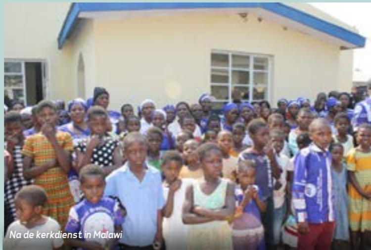
Na de kerkdienst in Malawi

In ons kerkblad lees ik een mooi opiniestuk over de verschillende belevingen van onze eigen kerkelijke gemeente. "Niet eens, wel één" heet het. Het eindigt met een lofzang over Jezus Christus en God de Vader eensgezind verheerlijken. Zo moet het ook zijn. Het verschil met de kerkdiensten in Zuid-Afrika en Malawi en mijn eigen kerkdiensten in Nederland is vele malen groter dan de verschillen van mijn wijkkerkgemeenten. Maar prachtig is het en ook bemoedigend om te horen dat, zowel in Nederland én in Zuidelijk Afrika, Jezus Christus gepreikt wordt.