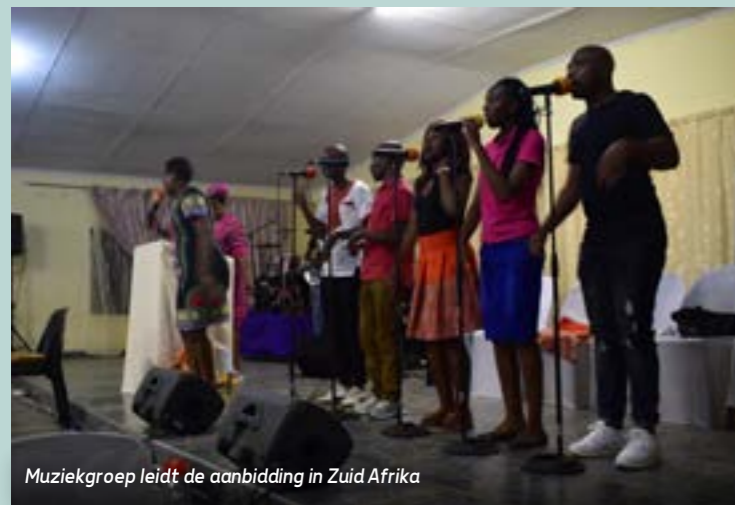
Muziekgroep leidt de aanbidding in Zuid Afrika

Ook hier wordt er veel aandacht aan de collecte besteed en wordt het offer uitgebreid gezegend. Aan het einde van de dienst staan we allemaal in een lange rij en geeft iedereen elkaar een hand op z'n Afrikaans, dat is drie keer. Dat is dus veel handen schudden maar het geeft wel een mooie verbondenheid.