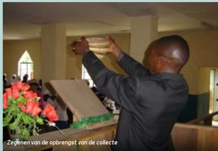
Zegenen van de opbrengst van de collecte