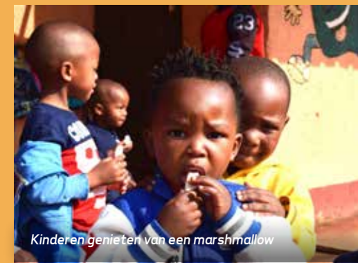
Kinderen genieten van een marshmallow