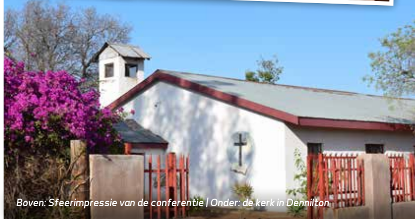
Boven: Sfeerimpressie van de conferentie | Onder: de kerk in Dennilton