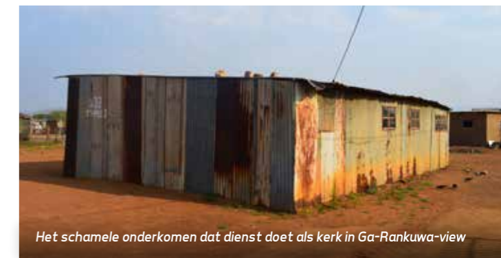
Het schamele onderkomen dat dienst doet als kerk in Ga-Rankuwa-view

Na het grote plan in Ga Rankuwa, vertrekken we naar Ga Rankuwa-view. Een kleine barak, waar een relatief jonge gemeente is gestart. Hopelijk kunnen we ook daar over enkele jaren een mooie kerk voor in de plaats laten zetten. Ook bezoeken we nog de prachtige zeer goed onderhouden kerk in Jericho, ooit gefinancierd door een zeer betrokken donateur.