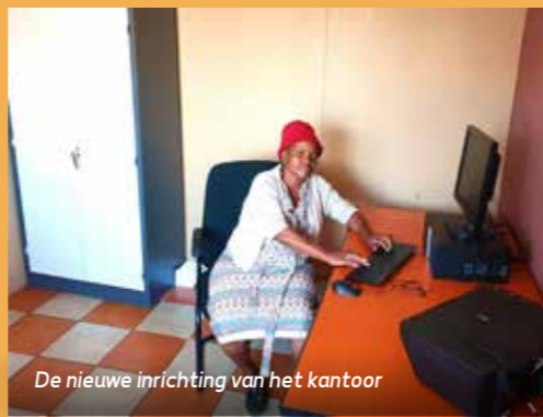
De nieuwe inrichting van het kantoor

en dat terwijl er over een paar dagen rond de 700 mensen komen voor de conferentie. Ergens verderop moet water gehaald worden uit een pomp. Het stinkt een beetje en smaakt voor onze verwende westerse begrippen ook niet lekker, zeker niet als er koffie of thee van wordt gezet.