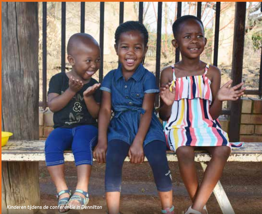
Kinderen tijdens de conferentie in Dennilton

In de vorige nieuwsbrief heeft u kunnen lezen over ons bestuursbezoek aan Malawi, afgelopen september. In deze nieuwsbrief leest u over het tweede deel van deze reis: het bezoek aan onze gemeenten en projecten in Zuid Afrika.