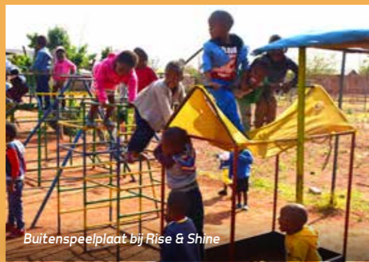
Buitenspeelplaats bij Rise & Shine