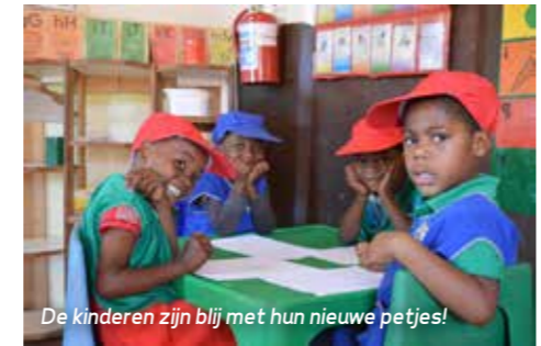
De kinderen zijn blij met hun nieuwe petjes!