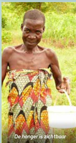
De honger is zichtbaar

IBAN NL34 INGB 0003 7233 35 o.v.v. Hongersnood Malawi