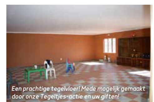
Een prachtige tegelvloer! Mede mogelijk gemaakt door onze Tegeltjes-actie en uw giften!