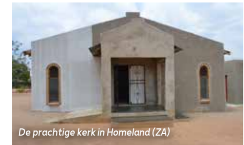
De prachtige kerk in Homeland (ZA)