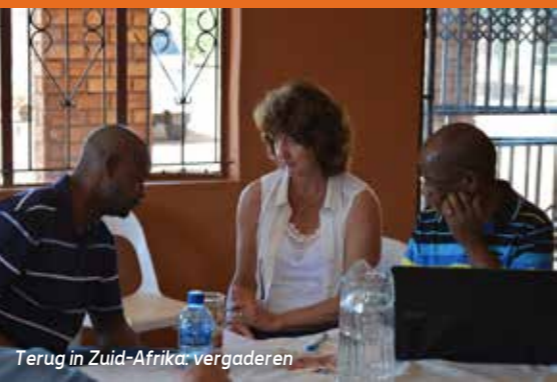
Terug in Zuid-Afrika: vergaderen