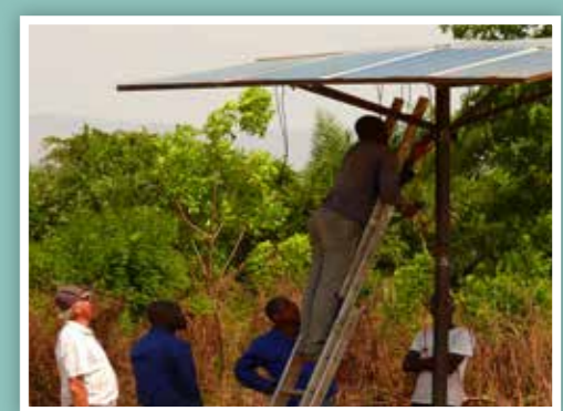
Het eerste oplaadpunt wordt geïnstalleerd

Tweede installatie in aantocht Een grotere installatie met meer zonnepanelen wordt nu opgezet bij een ziekenhuisje, waar dan ook een kleine koelkast aangesloten kan worden. Kortom: de stroomvoorziening is een nuttige hulp voor allen maar bovenal om in de avonduren nuttig met elkaar bezig te zijn en dat geeft ook aan Evangelisatie de ruimte om een Geestelijke opwekking in de gemeente in stroomversnelling te brengen.