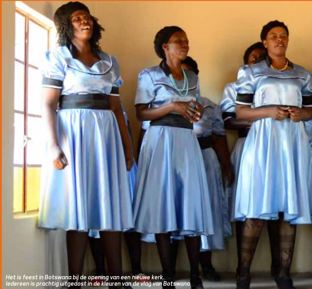
Het is feest in Botswana bij de opening van een nieuwe kerk. Iedereen is prachtig uitgedost in de kleuren van de vlag van Botswana