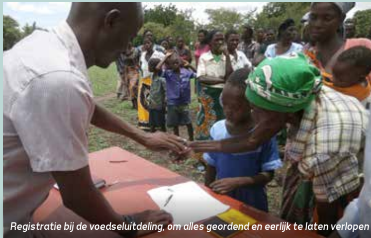
Registratie bij de voedseluitdeling, om alles geordend en eerlijk te laten verlopen

Van verschillende kanten ontvingen we extra steun en daar willen we jullie dan ook hartelijk danken! Onlangs hadden we een extra voedseluitdeling, waar we veel families een halve zak maïs konden geven. Volgende maand willen we dat weer doen en zo helpen we de mensen te overleven.