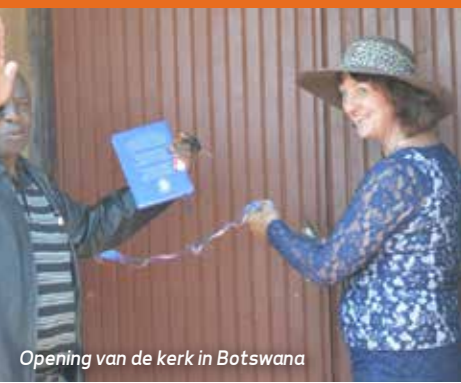
Opening van de kerk in Botswana