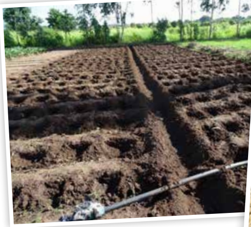
Een goede start voor het landbouwproject!

P3 • Jeugdactiviteiten Wells of Joy P4 • Project van het kwartaal: Corona en kinderen in Zuidelijk Afrika: uw gebed en financiële steun zijn meer dan welkom!